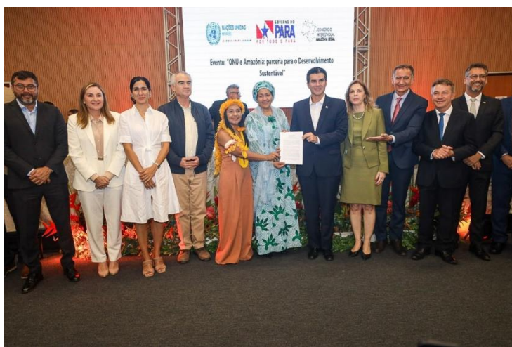
Lançamento do Fundo Brasil-ONU para o Desenvolvimento Sustentável da Amazônia, em Santarém/PA – 02.08.2023

Participaram do evento autoridades do Governo Federal, dos Governos dos Estados Amazônicos, de órgãos diplomáticos, de organismos internacionais, da sociedade civil e do setor privado, que discutiram esforços conjuntos para promover o desenvolvimento sustentável da Amazônia, em benefício dos 29 milhões de pessoas que vivem na região.