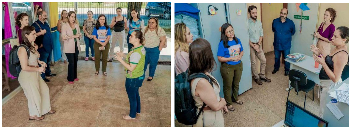
Visita conjunta do MPT e UNOPS ao CRAS São José Operário em Santarém/Pará

O encontro buscou fortalecer a parceria institucional entre UNOPS e MPT, e fazer o levantamento dos pedidos de destinação já existentes, para dar andamento ao projeto ministerial. Com a iniciativa, o MPT busca proporcionar a transformação social e econômica dentro de suas áreas de atuação, além de reforçar seu engajamento na busca pela efetivação dos Objetivos da Agenda 2030 da ONU.