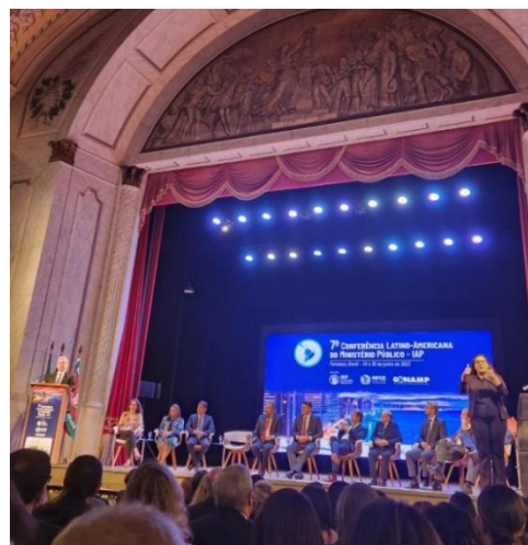
Abertura da 7ª Conferência Regional da Associação Internacional de Procuradores na América Latina, em Fortaleza/CE - 28.06.2023