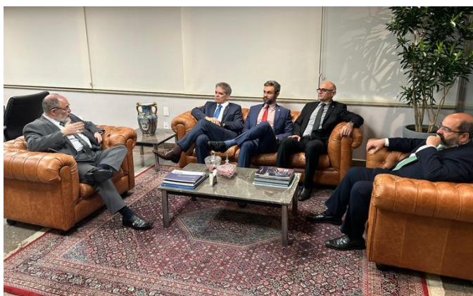
Visita institucional à sede do Ministério Público do Estado do Pará