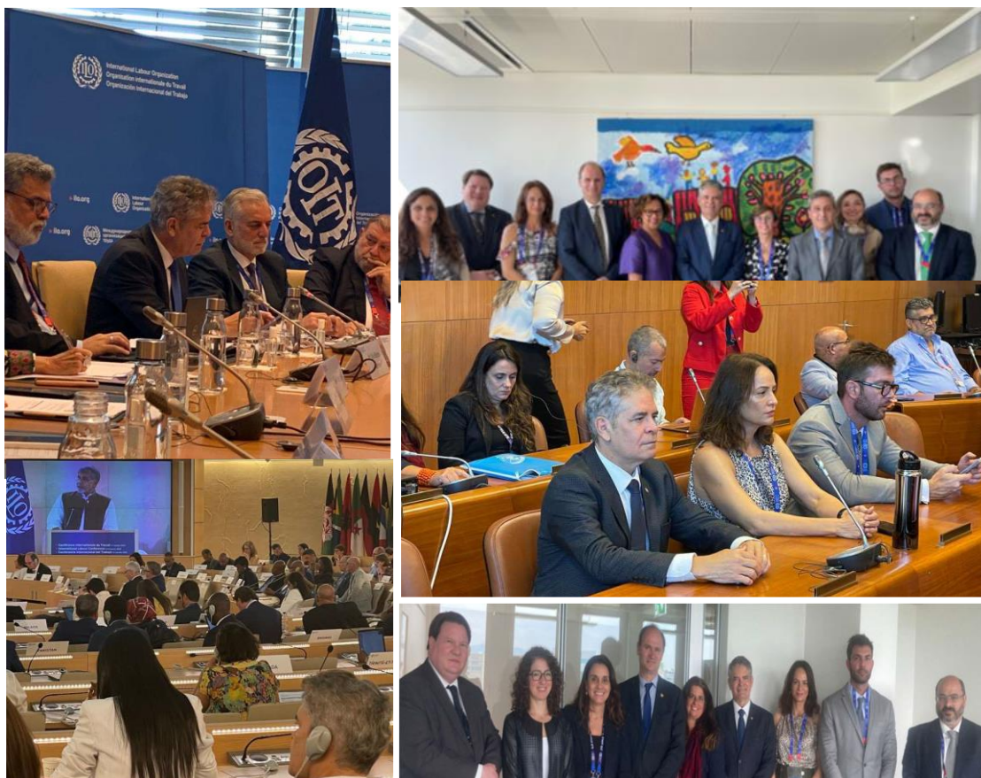
Participação do MPT na 111ª Sessão da Conferência Internacional do Trabalho da Organização Internacional do Trabalho, em junho de 2023 - Genebra/Suíça