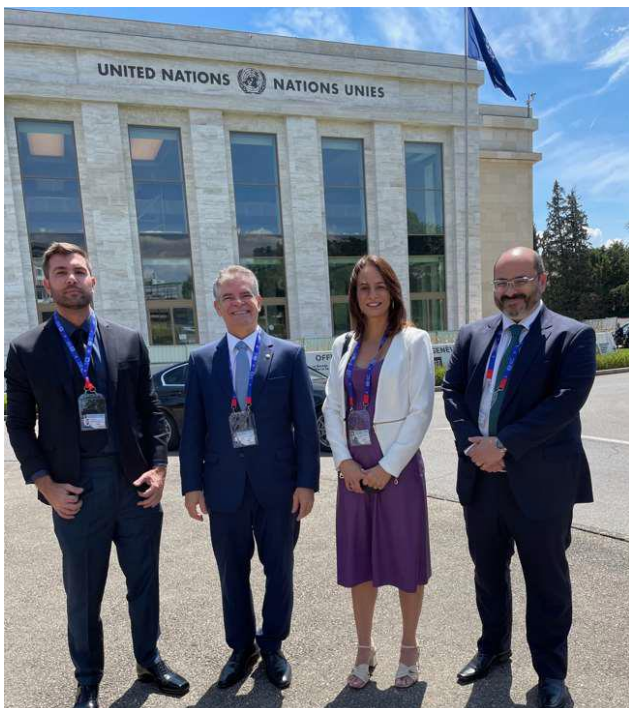
Comitiva do MPT na 111ª Sessão da Conferência Internacional do Trabalho (CIT) da Organização Internacional do Trabalho, em junho de 2023 - Genebra/Suíça