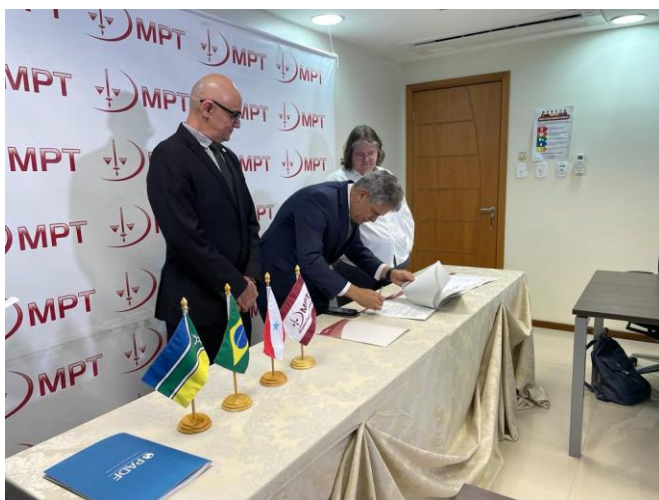
Assinatura do acordo de cooperação entre o MPT e a PADF, em Belém/PA, no dia 2 de maio de 2023

No dia 02 de maio de 2023, foi firmado, em Belém/PA, acordo de cooperação entre o Ministério Público do Trabalho e a Fundação Pan-Americana para o Desenvolvimento - PADF, cujo objeto é a conjugação de esforços para o fortalecimento das políticas públicas de direitos humanos, ações de promoção da democracia e governança. O documento foi assinado pelo Excelentíssimo Procurador-Geral do Trabalho, José de Lima Ramos