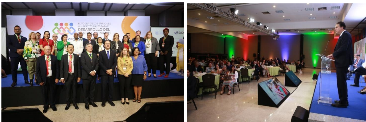
Abertura do Evento Regional de Alto Nível: "O Poder das Abordagens Multissetoriais para o Desenvolvimento do Capital Humano", em Brasília/DF – 29.08.2023

Entre os dias 29 e 31 de agosto de 2023, cerca de 200 participantes de mais de 20 países, entre ministros de governo, representantes de instituições financeiras internacionais e das Nações Unidas, reuniram-se em Brasília, para o evento “O Poder das Abordagens Multissetoriais para o Desenvolvimento do Capital Humano”, organizado pelo Programa Mundial de Alimentos (WFP) das Nações Unidas e pelo Banco Interamericano de Desenvolvimento (BID).