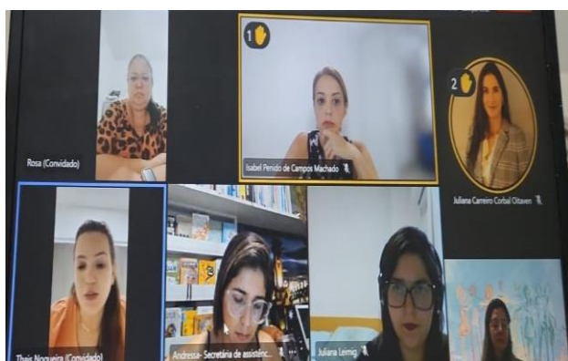
Reunião virtual GEAF Fábrica de Fogos - dia 10.05.2023