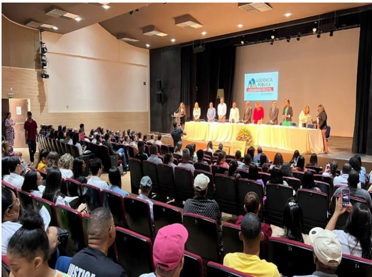
Audiência pública em Santo Antonio de Jesus/BA - dia 18.07.2023

Após, no dia 18 de julho de 2023, ocorreu audiência pública sobre o caso no teatro do SESC do município de Santo Antônio de Jesus, no Estado da Bahia. O evento teve como objetivo principal prestar contas das atividades desenvolvidas e coletar, junto à sociedade e ao Poder Público, elementos que possam contribuir para o adequado cumprimento da decisão proferida pela Corte IDH no Caso Empregados da Fábrica de Fogos de Santo Antônio de Jesus e seus familiares Vs. Brasil , especialmente por meio da ampliação do diálogo social e conhecimento da população quanto ao significado da decisão. Ademais, no dia seguinte, 19 de julho de 2023, foi promovido um seminário que reuniu especialistas de direito do trabalho e saúde e segurança, com o objetivo de capacitar agentes públicos locais de forma a integrar as ações de diversos órgãos públicos.